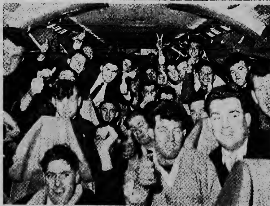
Aki nos por mira un grupo di militarman ingles bisti na civil den avion pa Singapore caminda nan lo reemplaza e trupanan cu actualmente ta bringa na Broenei. Ora nan a puntra pakico e militarman ta biaha na civil nan a contesta cu asina ta mas agradabel pa biaha y nan lo hanja uniformenan specialmente pa tropico ora cu nan jega.

Den un declaracion cu e secretariado di duke en nan a saka na Paris nan ta yama e rapport absurdo. Maske tin hopi cos cu no ta berdad den e noticianan aki, nan mester recorda, cu e duke ta satisfice e mayoria dje pueblo cu tin interes na Gran Britania, y nan ta desea compresion mutuo cu Alemania, apesar dje hecho cu Hitler tabatin poder ayanan.